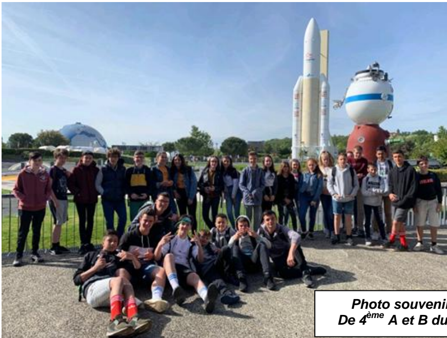
Photo souvenir du voyage à Toulouse des élèves De 4 ème A et B du Collège Saint Joseph (6-7 mai 2019)